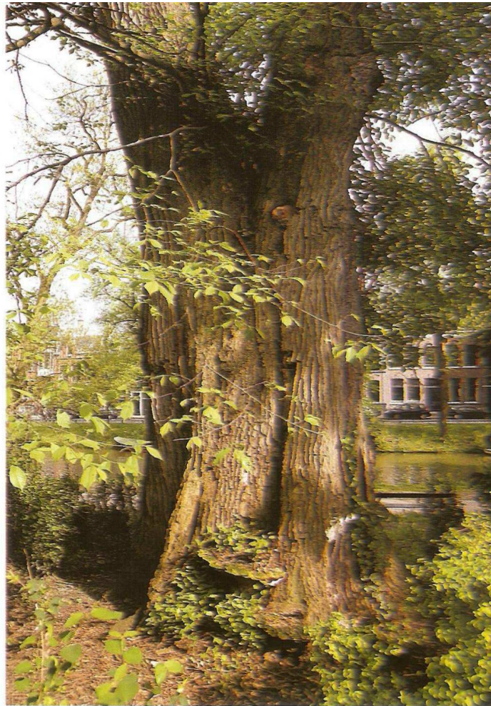
Grote Iep ( Ulmus glabra 'Cornuta') in het Tolsteegplantsoen tussen Zonnenburg en Manenburg (Utrecht, 2010). Deze 'dikste Iep van Nederland' is vermoedelijk bij de aanleg door Zocher uit meerdere bomen samengesteld. De schors is verschillend rondom de boom.

in eine und dieselbe Grube, und auch wohl Gabelförmig gepflanzt, fünf, sechs wohl auch einmal in eine fast grade Linie gestellt werden u.s.w. .... Einen sehr hübschen Effect bringt es oft hervor, zwei ganz verschiedenartige baumarten, wie etwas Birke und Erle, Weide und Eiche, ... in dieselbe Grube mit einander zu pflanzen, oder einen Baum, fast horizontal übers Wasser gebeugt, schief aufwachsen zu lassen. Pückler raadt ook aan een enkele boom of boomgroep enigszins verhoogd te planten, omdat dat een meer gracieuze vorm geeft en oude bomen die spontaan te samen opgroeien bijna altijd op een dergelijk heuveltje staan. (p.46)