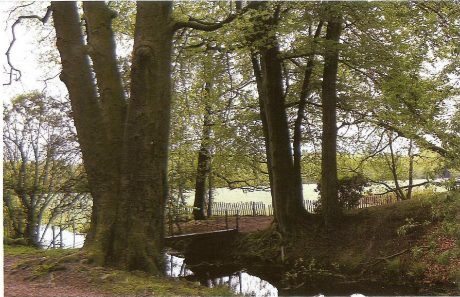
Vierstammige Beuk ( Fagus sp. ) bij een brug van Houdringe (De Bilt, 2010)