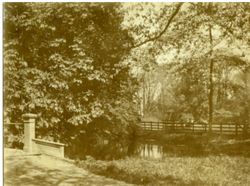
Het 19de eeuwse park

In het veendorp Kralingen werden vanaf de 17de eeuw buitenplaatsen aangelegd langs de Oude Dijk.